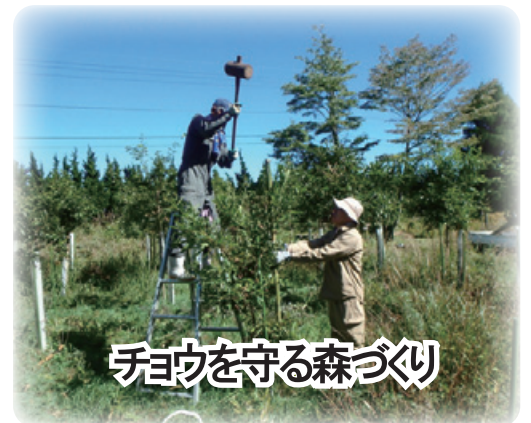
チョウを守る森づくり