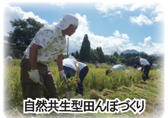
自然共生型田んぼづくり